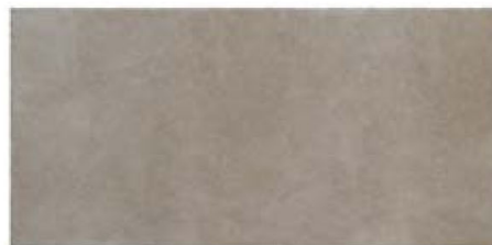
ST137004F PROXI TORTORA 48 X 96