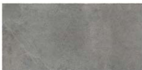
ST137002F PROXI GRIGIO 48 X 96