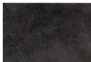
ST152024 CIMENT NERO 32X48