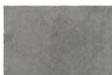
ST137022F PROXI GRIGIO 32 X 48