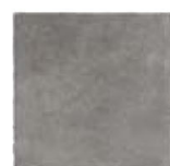
ST137032F PROXI GRIGIOF 32 X 32