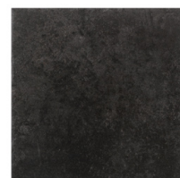
ST152034 CIMENT NERO 32X32