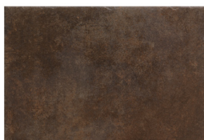
ST152023 CIMENT RUGGINE 32X48