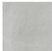
ST137011F PROXI BIANCO 48 X 48