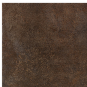
ST152013 CIMENT RUGGINE 48X48