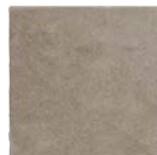
ST137014F PROXI TORTORA 48 X 48