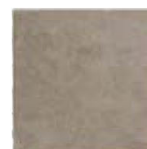
ST137034F PROXI TORTORA 32 X 32