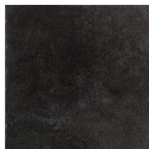
ST152014 CIMENT NERO 48X48