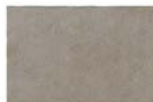
ST137024F PROXI TORTORA 32 X 48