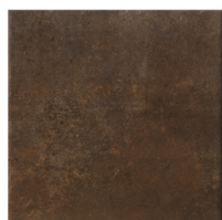
ST152033 CIMENT RUGGINE 32X32