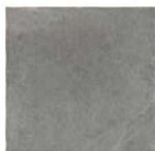
ST137014F PROXI TORTORA 48 X 48