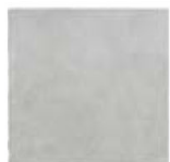
ST137031F PROXI BIANCO 32 X 32