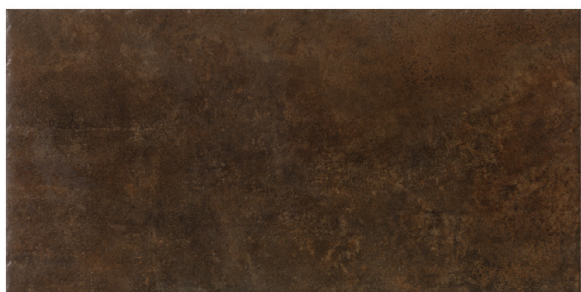
ST152003 CIMENT RUGGINE 48X96