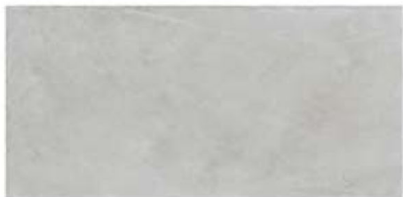
ST137001F PROXI BIANCO 48 X 96