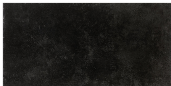
ST152004 CIMENT NERO 48X96