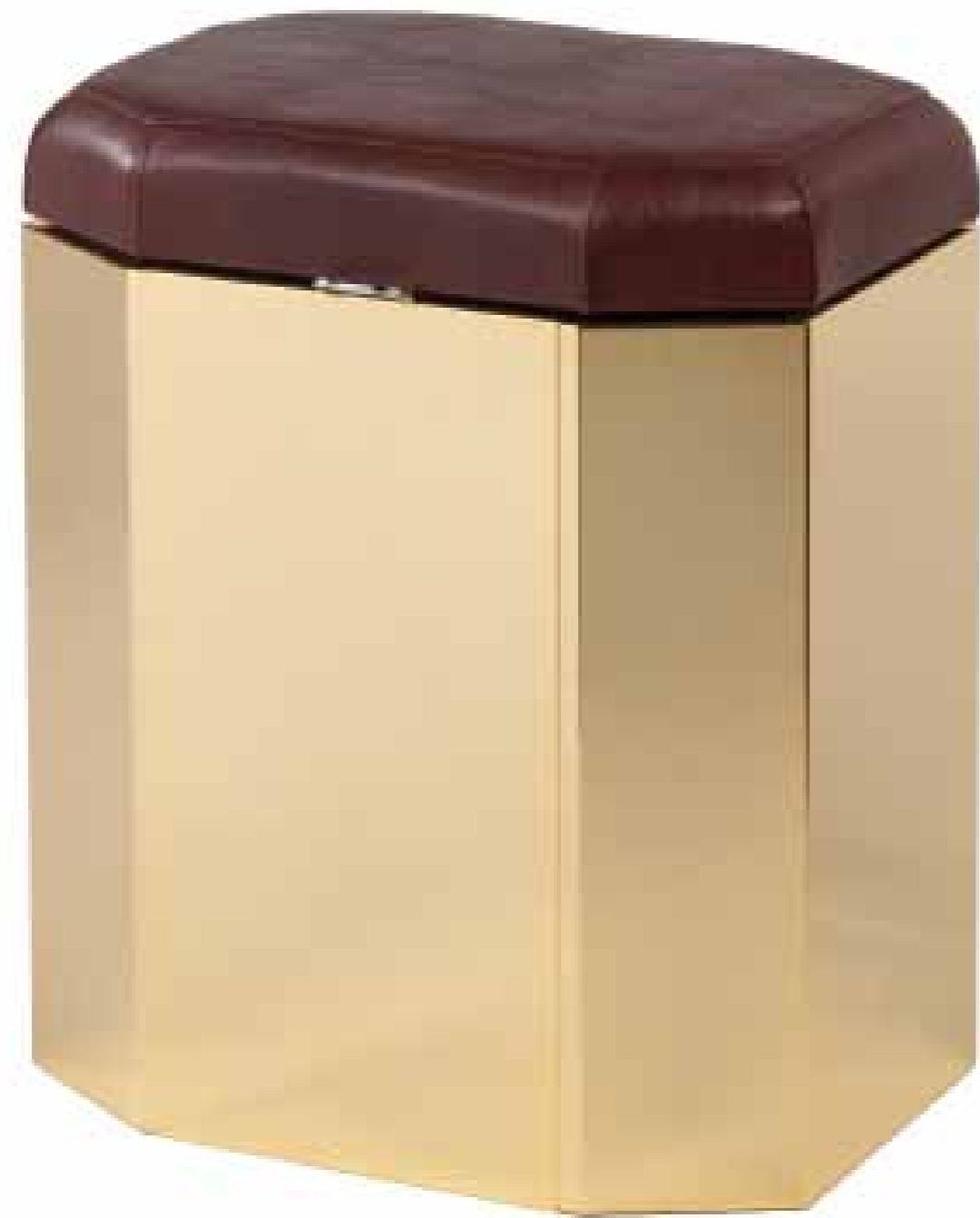
Nella definizione delle forme la ricerca dell'impatto scultoreo.