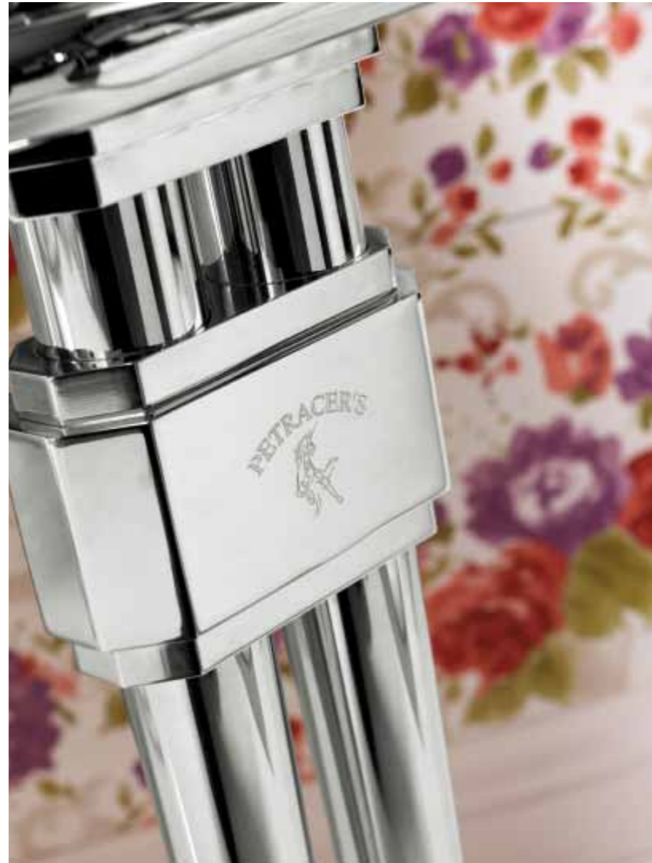
La versione cromata esalta la leggerezza della forma.