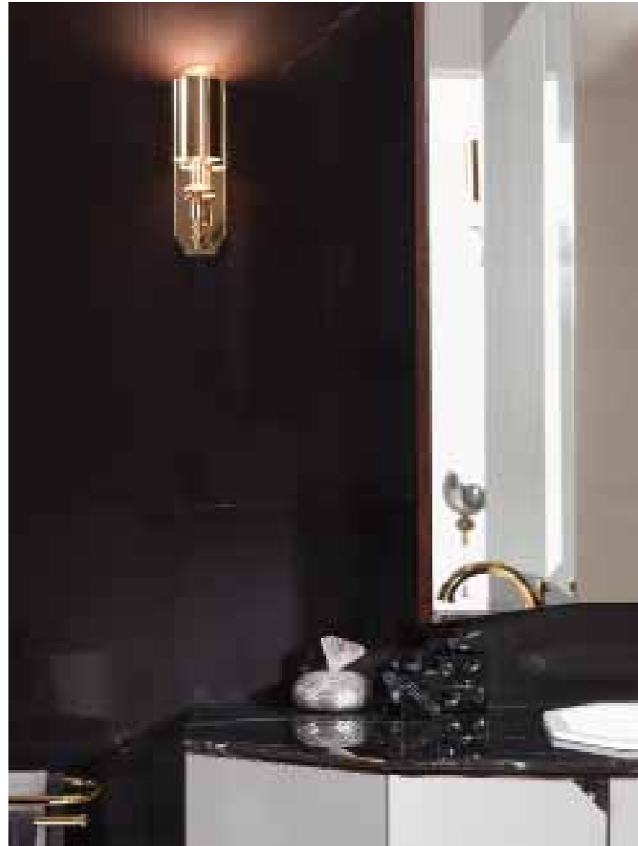
Irrinunciabile specchio: in forma di trittico con ante laterali movibili.