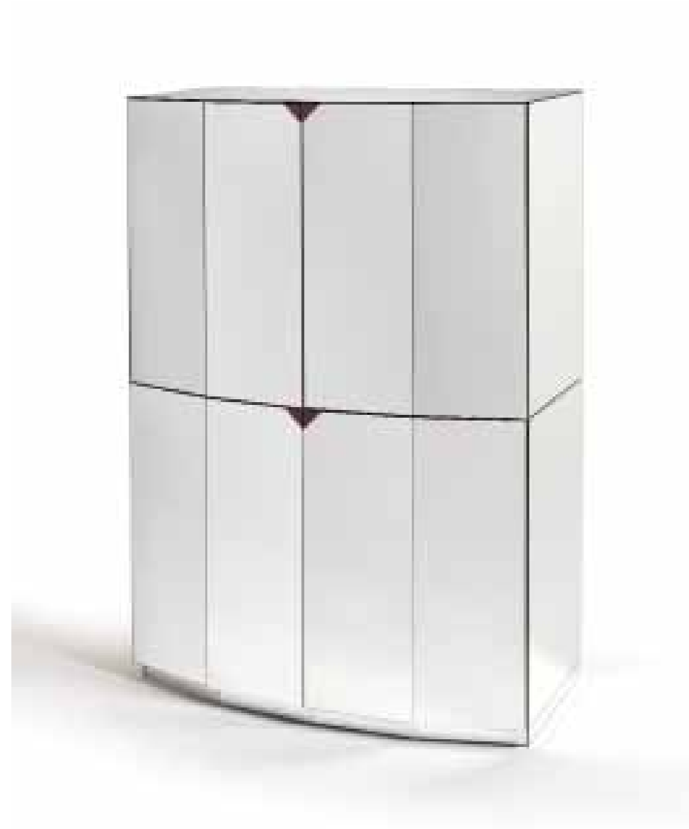
Il tema ricorrente, l'ottagono irregolare, disegnato dal ritmo dei riflessi.