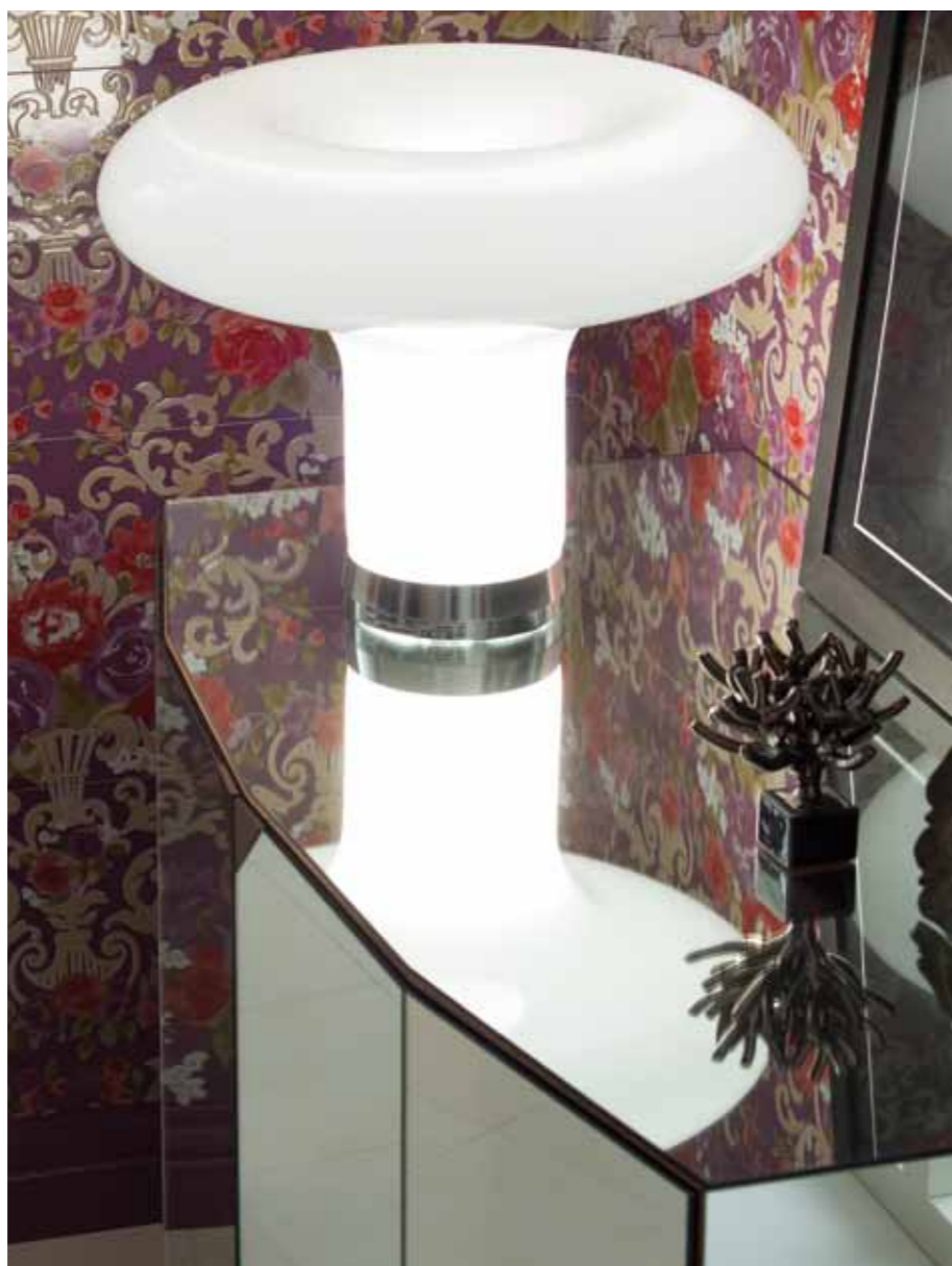
Nel gioco di riflessi un continuo rimando tra l'oggetto d'arredo e l'ambiente.