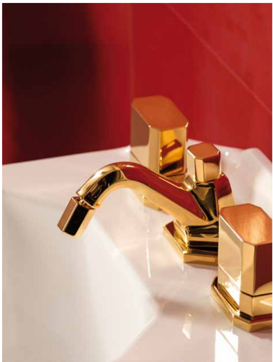
Bianco seducente con i riflessi dorati della rubinetteria.