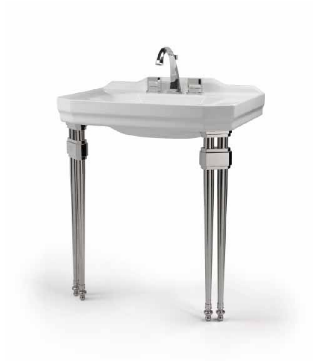
Originalità anche nelle possibilità compositive.