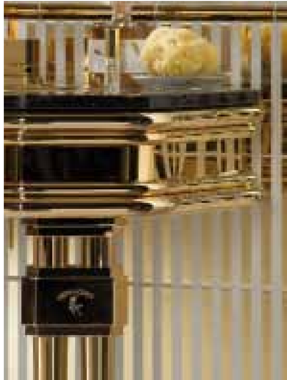
Finezza dei dettagli nel pregio delle lavorazioni.